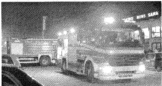
Alcuni mezzi dei vigili del fuoco

VICOPISANO. La Misericordia di Vicopisano anche per quest'anno organizza la lotteria di Natale con ricchi premi, quest'anno saranno ben 9 premi, a partire da un televisore Lcd 32" ad un pc portatile, da una cena per 4 persone a 1 biglietto per 2 persone A/R per la corsica o la Sardegna, ecc. il costo di ogni biglietto è di euro 1,50 cad. ed è possibile acquistarlo presso la sede della misericordia (dove troverete esposti anche i premi), nei negozi del comune e al mercatino del collezionismo di Vicopisano che si terrà domenica 9 dicembre presso la piazza di Vicopisano. Come ogni anno verrà anche organizzato Babbo Natale, un'iniziativa del gruppo volontari che per l'ottavo anno consecutivo porterà la sera del 25 dicembre babbo natale direttamente a casa vostra, basta prenotare la visita telefonando al centralino della Misericordia 050 798368.