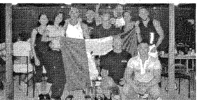
Il campione in mezzo agli amici festeggia i risultati