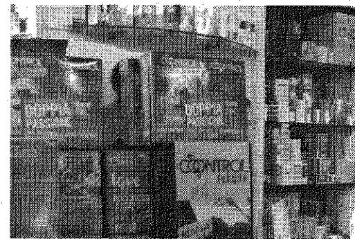
Preservativi in vendita all'interno di una farmacia

vendica il diritto alla prevenzione sessuale a prezzi di mercato, considerato che una confezione di condom da sei preservativi all'inglese - va dai 5 euro in su? Per ora niente di buono. «Il profilattico è così diffuso che fare una campagna solo di un paio di giorni sarebbe ridicolo. E ancora farla per più tempo, andrebbe solo a promuoverlo tra chi già lo usa e non tra quelle fasce sociali insensibili. E là che dovremmo arrivare». Magari l'obiettivo primo potrà essere difficile da conquistare con una sola campagna. Ma visto il tema, forse varrebbe la pena tentare.